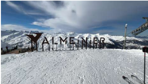
Vue panoramique du haut des pistes.

Durant cette semaine, les étudiants se sont vraiment beaucoup amusés, car ce voyage a permis à beaucoup d'entre eux de se rapprocher les uns des autres et de créer de nouveaux liens. Les deux classes ont eu le sentiment de vivre une expérience unique et de passer des moments conviviaux. Et qui dit « séjour à la montagne » dit forcément de longues journées passées sur les pistes de ski : entre les chutes, les virages, et la patience dont ont fait preuve les professeurs pour leur apprendre à skier, plusieurs étudiants se sont trouvés un penchant pour ce sport. À l'image de cet étudiant débutant qui partage son expérience : « Ce fut un moment extraordinaire ! Moi, débutant, qui n'avait point touché de skis de ma vie, j'ai pu descendre des pistes noires à la fin de la semaine. L'excitation et l'adrénaline de la descente m'ont fait me sentir vivant. C'était difficile, mais j'étais fier de surmonter ces défis ! »