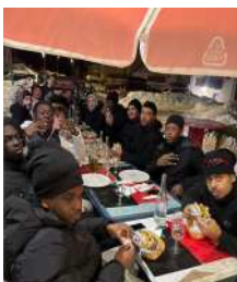
Les moments de convivialité.