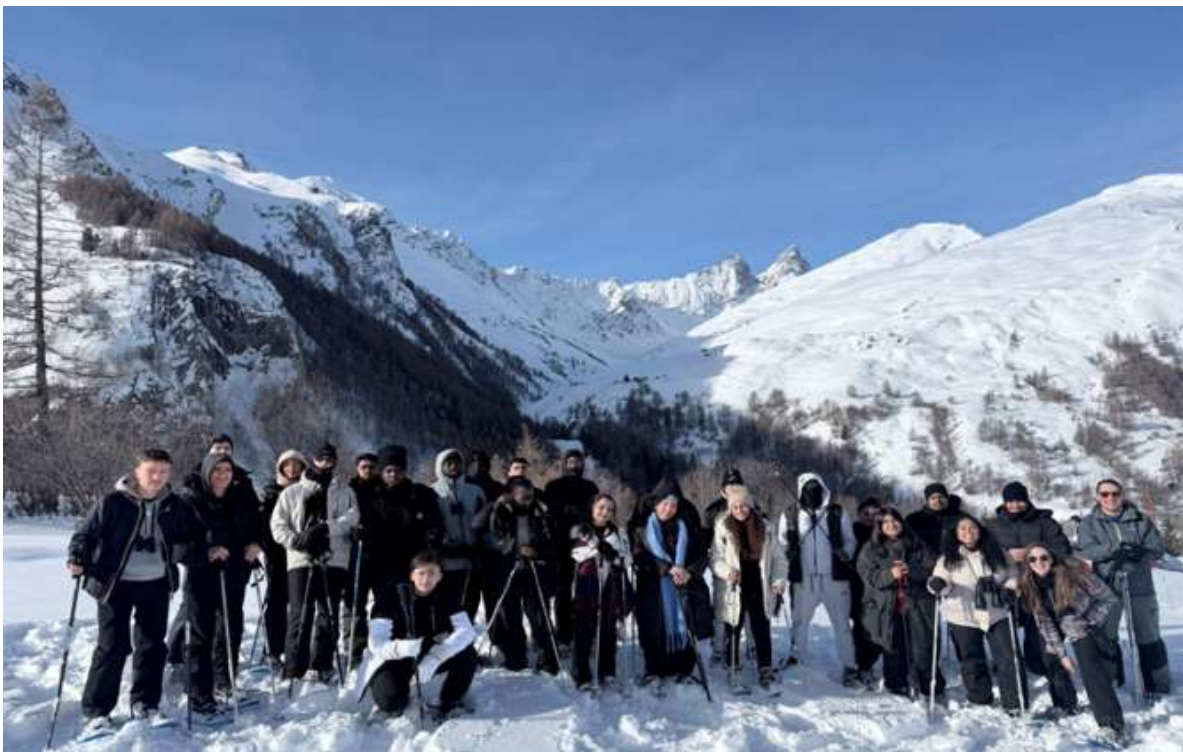
Groupe composé des étudiants de BTS et DCG et professeurs, participant à la randonnée en raquettes. À la découverte des animaux de la montagne.