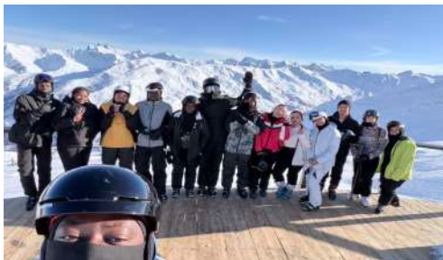
Photo de groupe en haut des pistes.